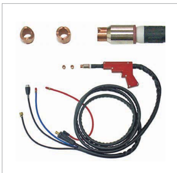
Горелка точечной TIG сварки spotArc, жидкостное охлаждение