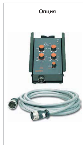
Дистанционный регулятор spotArc RTP 3

[i] Функция spotArc присутствует во всех аппаратах серии TETRIX