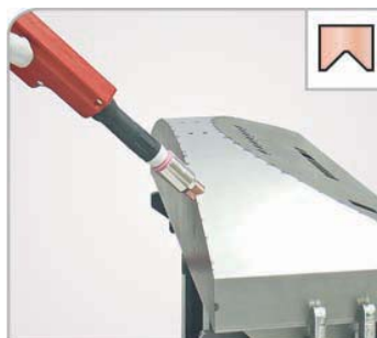
Угловой шов Прихватка на корпусе электрошкафа