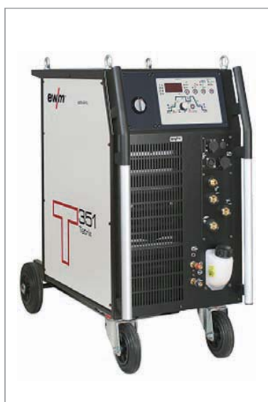
например: сварочный аппарат TETRIX 351 activArc