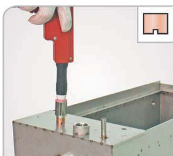
Плоский шов Соединение двух листов